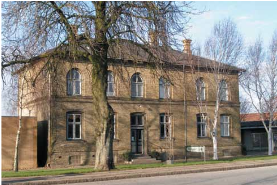
Kongeå-museet i Vamdrup

Fællesturen til Kongeåen er arrangeret af Grænseforeningen. Alle er velkomne.