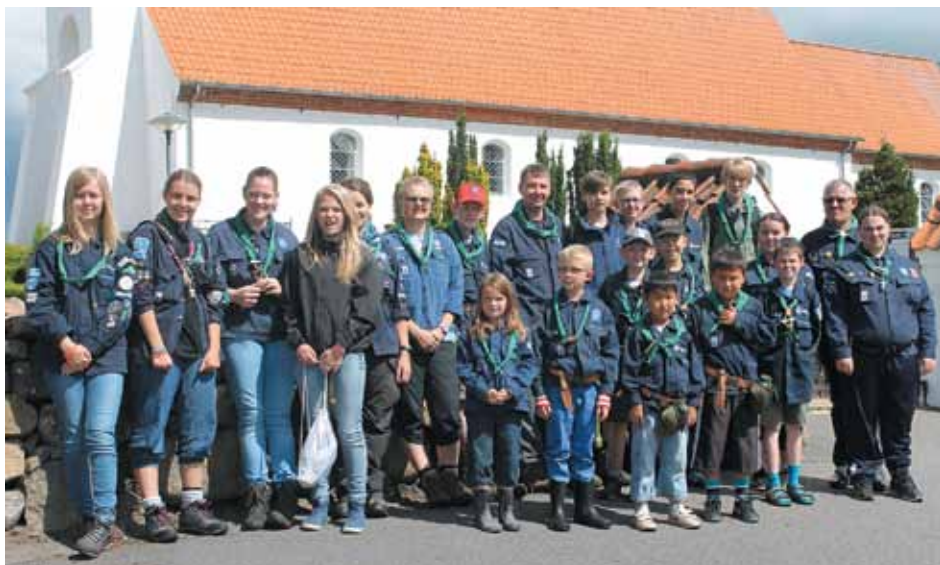
Thorningspejderne er klar til afgang mod Holstebro.

Der var spejdere med fra 25 lande og 35.000 deltagere til danmarks største lejr nogen sinde. Thorning lå sammen med 500 andre spejdere fra Silkeborg Kommune.